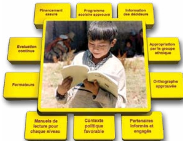
Schéma conçu par Susan E. Malone, doctorat en sciences de l'éducation

Composantes d'un programme d'éducation multilingue durable